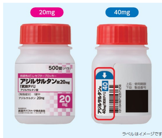
ラベルはイメージです