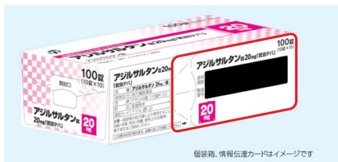
個装箱、情報伝達カードはイメージです

情報伝達カードには【製品名】【含量】【使用期限】【製造番号】【GS1コード】が記載されています。