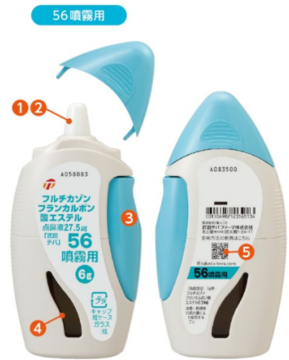
ラベルはイメージです