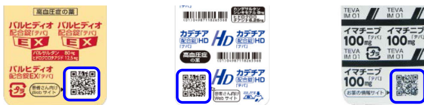
図 PTP シート裏面に QR コードを表示

【バルヒディオ®配合錠、カデチア®配合錠 QR コード】 高血圧患者さん向け情報 Web サイト：高血圧の基礎知識や日常生活の中で簡単にできるリラックス法などを紹介