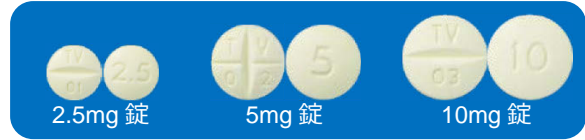
図 裏面に含量を大きく刻印し、分割しやすいよう割線を入れた錠剤